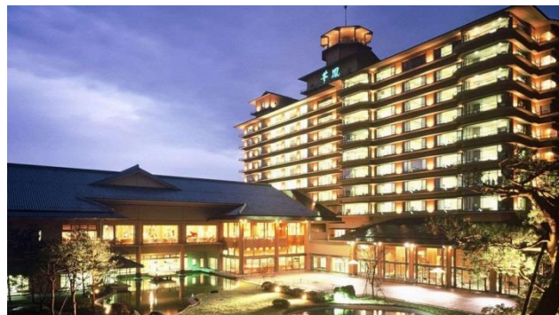
画像はイメージになります。

〒959-2395 新潟県新発田市月岡温泉134番地 TEL:0254-32-1515 FAX:0254-32-1511