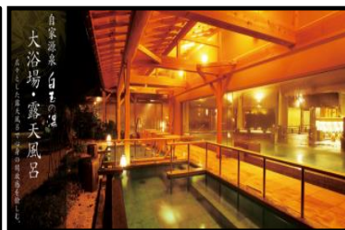
画像はイメージになります。

※弊社手配数をオーバーした場合、別の宿泊施設をお願いする場合がございます。ご了承下さい。