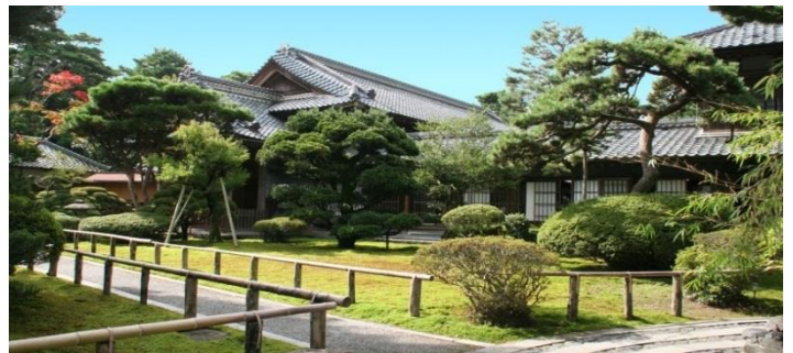
■画像はイメージになります。